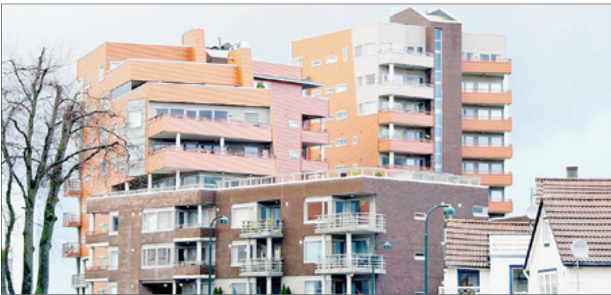
از دهه ۳۰ و با سرعت گرفتن رشد تهران به سمت شمال، رفته رفته ساخت آپارتمان در تهران هم رونق گرفت.